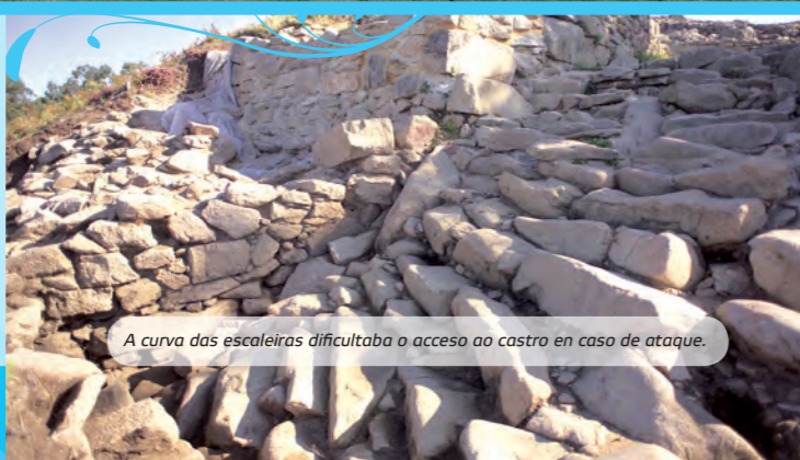
A curva das escaleiras dificultaba o acceso ao castro en caso de ataque.

No obradoiro de cerámica castrexa podemos ver como se elaboraba a cerámica hai máis de 2000 anos: as mesmas olas, xerras e pratos que utilizaban os habitantes de Castrolandín. Entrada ao castro libre. Para a reserva de visitas guiadas, audioguías e obradoiros didácticos: visitas@castrolandin.es ou no Tlf. 986 53 26 68