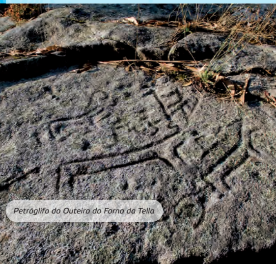
Petróglifo do Outeiro do Forno da Tella

Os gravados de forma circular ou labiríntica son os máis abundosos. Para moitos arqueólogos, as representacións con animais indican lugares de caza ou de paso das mandas.