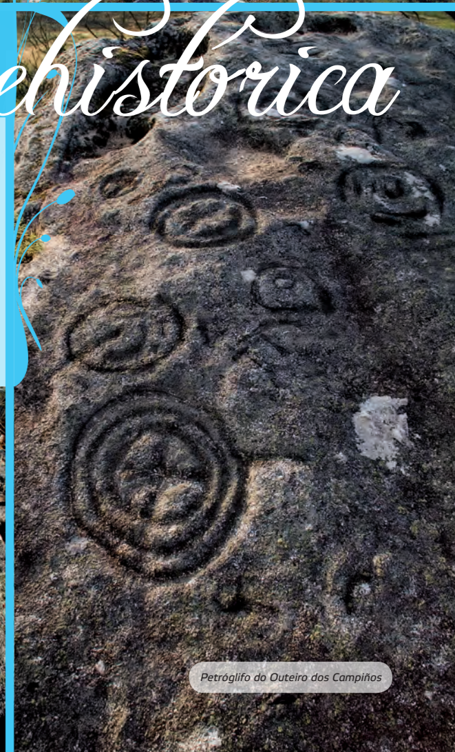
Petróglifo do Outeiro dos Campiños